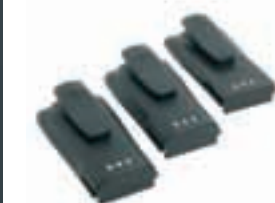
Литий-ионный аккумулятор повышенной емкости, тонкий литий-ионный аккумулятор и никель-металлогидридный аккумулятор – NNTN4497, NNTN4970 и NNTN4851