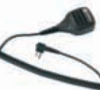
Выносной микрофон с улучшенными характеристиками шумоподавления (IP57) – MDPMMN4029