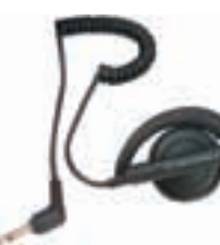
Наушник с держателем для подключения к выносному микрофону – WADN4190