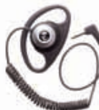
Наушник для подключения к выносному микрофону – MDPMLN4620