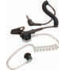
Наушник скрытого ношения для подключения к выносному микрофону – MDRLN4941